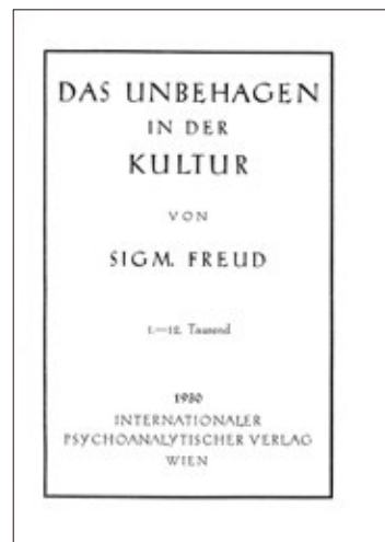
Voorplaten en titelpagina's van tweede en eerste drukken van Die Zukunft einer Illusion (1928) en Das Unbehagen in der Kultur (1930).