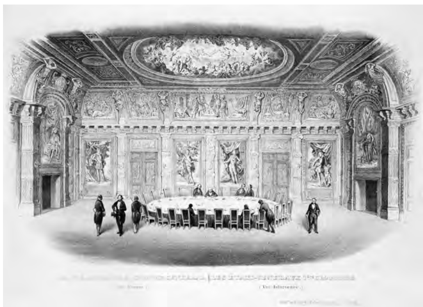
De Eerste Kamer vergadert in de historische Trêveszaal. Anonieme prent, 1844

hadden vergaderd: de Trêveszaal in het voormalige Generaliteitskwartier. In het licht van het karakter van de Eerste Kamer lag de keuze voor de Trêveszaal als vergaderplaats enigszins voor de hand. In de eerste plaats was de Trêveszaal nog altijd een van de meest indrukwekkende zalen op het Binnenhof. Daarnaast sloot ook het decoratieprogramma van de ruimte goed aan bij de aard van het nieuwe vertegenwoordigende lichaam. De gehele ruimte was immers versierd met symbolische voorstellingen die de eenheid tussen de gewesten en de onlosmakelijke band tussen het Huis van Oranje en de Nederlanden verbeeldden. 115