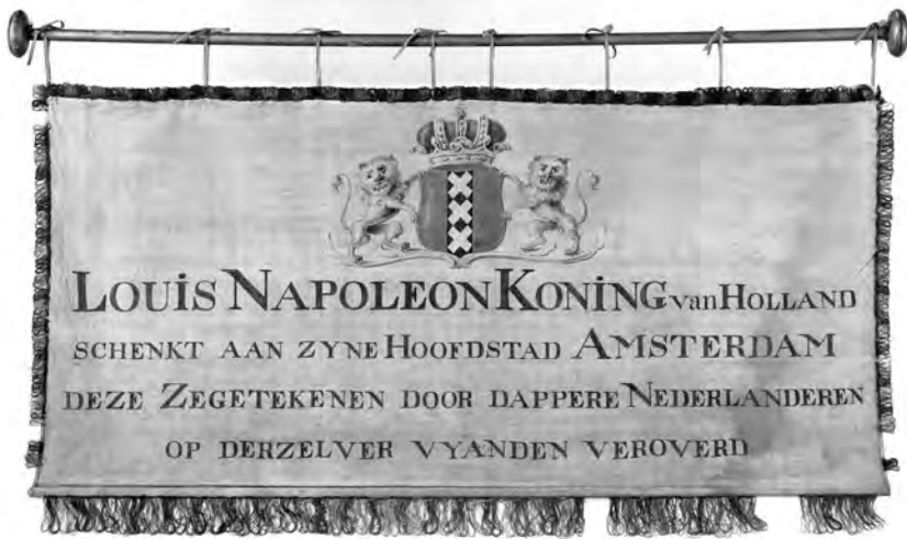
Vaandel ter gelegenheid van de overdracht van de zegetekenen uit de Grote Zaal op het Binnenhof naar de nieuwe hoofdstad Amsterdam. Anonieme vervaardiger, ca. 1807 (collectie Rijksmuseum)

uitgebreide briefwisseling van Lodewijk valt op te maken dat de vorst al meteen na zijn intocht de voorkeur gaf aan Huis ten Bosch, om vervolgens na een kleine maand Den Haag helemaal te verlaten en de rest van het jaar door te brengen op verschillende plaatsen in Duitsland. Van de vier jaar dat het koningschap van Lodewijk Napoleon duurde, zou hij uiteindelijk slechts een kleine zes maanden op het Binnenhof verblijven, van december 1806 tot mei 1807. 11 Ook de koningin, Hortense de Beauharnais, beleefde weinig vreugde aan de Hofstad. Ze voelde zich er erg ongelukkig, temeer daar kort na haar intrek in Den Haag, op 5 mei 1807, haar oudste zoon stierf aan difterie. Een verlies dat niet alleen de verdere relatie met haar man zou bepalen, maar ook die met het in haar ogen koude, winderige en treurige Den Haag. 12