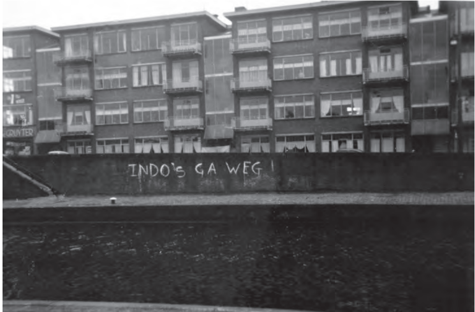
'Indo's ga weg' op de kademuur van de Soestdijksekade te Den Haag.

len in de pers werd geschonken en de bagatellisering van het probleem door politici en ambtenaren stonden met elkaar in contrast. Die grote aandacht in de pers had een paradoxale oorzaak: enerzijds werd verschil benadrukt, met name in uiterlijk en kleding en door het gebruik van de oorlogsmetafoor, anderzijds werd verschil ontkend. Die bagatellisering lag in het de acceptatie door de politiek dat deze groep Indische Nederlanders in Nederland bleef en dat erkenning van een probleem zou betekenen dat Nederland daar een verantwoordelijkheid voor had. Het zou tevens het zelfbeeld van Nederland als tolerante en gastvrije natie ter discussie stellen door de mogelijkheid dat er racisme zou bestaan in Nederland.