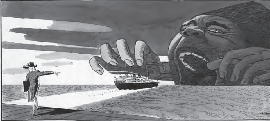
De 37 verstekelingen werden terug naar Indonesië gestuurd. 'Z. Exc. Samkalden: „Nou, tabeh dan...”'