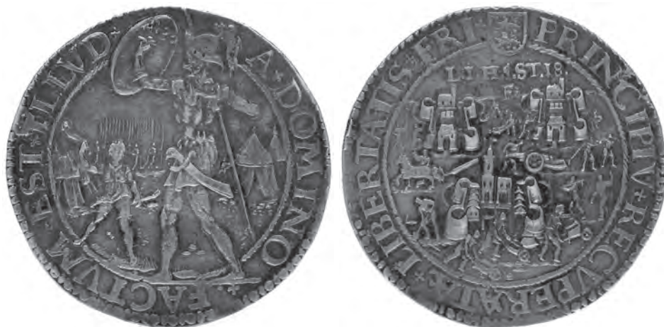
Afb. 2 Gedenkpenning ter gelegenheid van het neerhalen van de blokhuzen van Leeuwarden, Harlingen en Stavoren op 1, 5 en 18 februari 1580.

ge maar geïdealiseerde én positief ervaren verleden kon worden verzoend met de in het staatsvormingsproces sinds 1498 ontstane instituties en machtsverhoudingen.