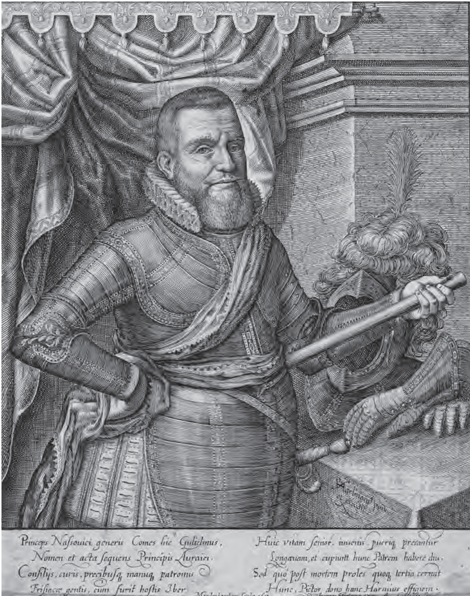
Afb. 6 Portret van graaf Willem Lodewijk van Nassau-Dillenburg, door Pieter Feddes van Harlingen. Gravure uit 1614.