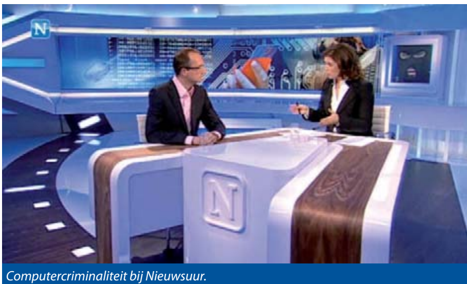
Computercriminaliteit bij Nieuwsuur.

Tóch denk ik dat de bevoegdheid tot het afgeven van een Notice-and-Take-Down-bevel er moet komen. Er zijn zeker situaties te bedenken waarin een afdwingbaar NTD-bevel wenselijk is. Bijvoorbeeld wanneer kinderpornografie wordt gehost, een botnet wordt aangestuurd of spam wordt verstuurd, bij een 'bulletproof hosting provider' in Nederland. Bij dit soort dienstverleners is het een onderdeel van hun business model niet mee werken met