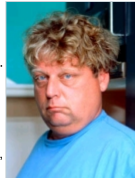
Theo van Gogh