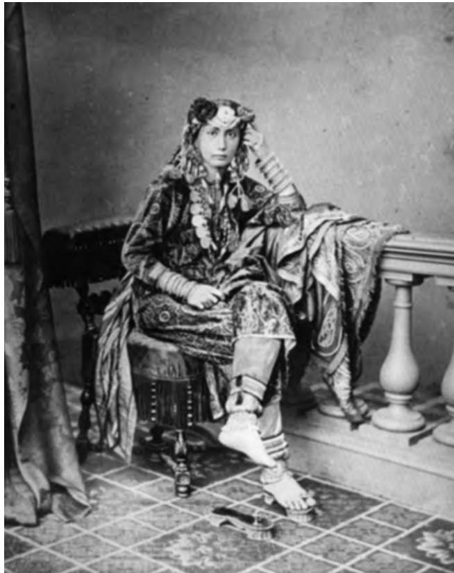
Prinses Salme, Emily Ruete (Hamburg, ca. 1868).