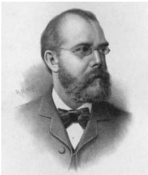
5. Robert Koch, ontdekker van de cholera-bacterie.

drinkwater, door het niet in quarantaine houden van ziek vee), en ook zelf zorg moest dragen voor de bestrijding ervan. Als iemand beweerde dat ziekte een straf van God was voor zonden, moest hij volgens sommige modernen eigenlijk ook afzien van zaken die hem beschermden tegen het krijgen van ziekten, en zo de consequenties dragen van het idee dat God hem strafte: