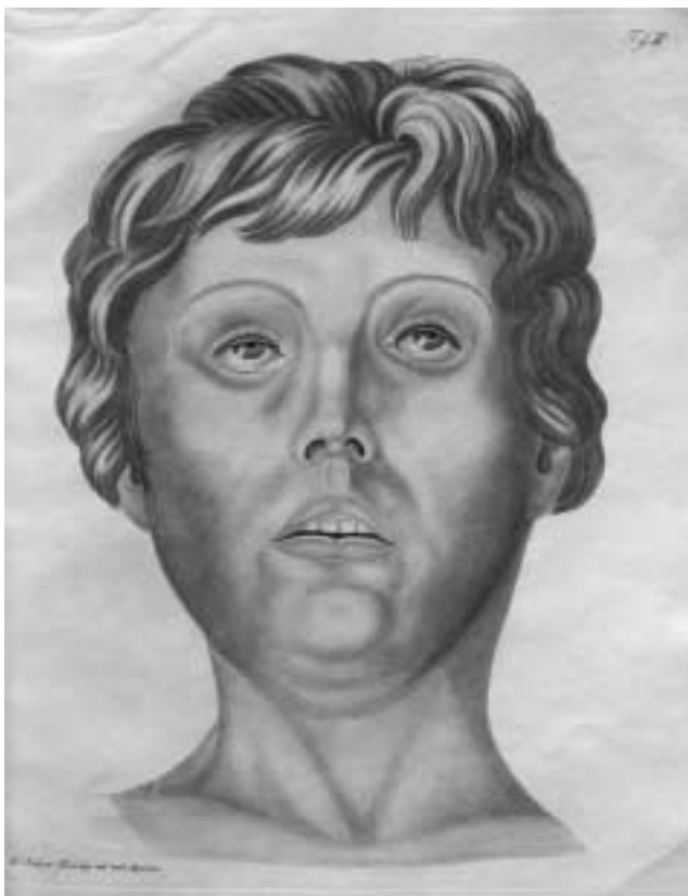
1. Afbeelding van elfjarige jongen die aan cholera overleden is uit medisch handboek uit 1832.

Zingeingsvragen ontstonden niet alleen door de hoeveelheid slachtoffers die de cholera eiste maar ook door het grillige verloop van de ziekte. Cholera begint meestal met onduidelijke symptomen, waarna snel hevige aanvallen van diarree en overgeven volgen. Een choleralijder kan dan een kwart van het lichaamsvocht verliezen. Hierdoor verloopt de doorbloeding niet goed meer, waardoor de huid blauw wordt. De ogen vallen in, en handen en voeten worden koud. Sommige patiënten herstellen na deze fase; velen overlijden echter. Vaak duurt dit proces drie tot vier dagen, maar soms overlijdt de patiënt al binnen een paar uur nadat hij de eerste verschijnselen vertoonde. 8 De cholera-bacterie bevindt zich in de ontlasting en het braaksel van een besmet persoon en verspreidt zich vooral via besmet drinkwater of water dat als waswater is gebruikt, maar ook wel door het drinken van melk, door het eten van bepaald voedsel, of van mens op mens. 9